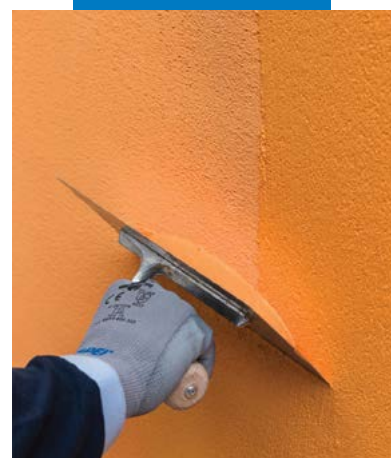
Acabamento com aplicação com espátula de Elastocolor Tonachino Plus sobre Mapetherm Flex RP 1,5 mm