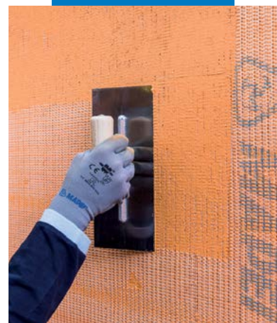
Inserção de Mapetherm Net na camada fresca de Mapetherm Flex RP