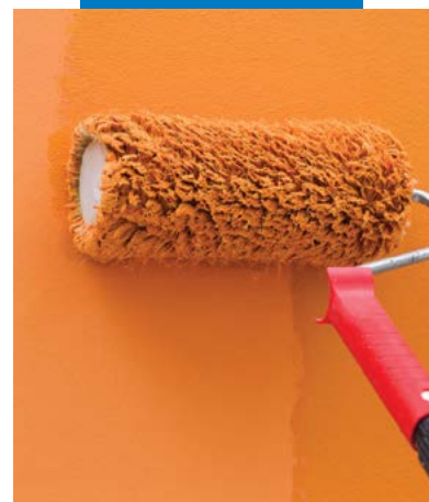
Acabamento com aplicação a rolo de Silancolor Pittura Plus sobre Mapetherm Flex RP 0,5 mm