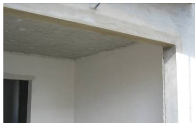
Aspeto final com talochamento