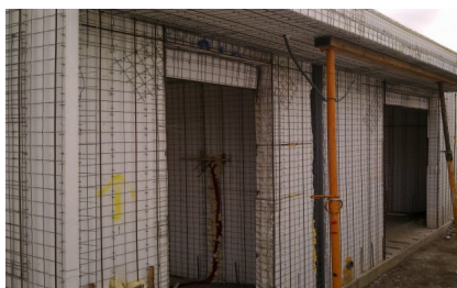
Preparação do suporte

A espessura total da lâmina de compressão deve ser obtida através da aplicação de camadas sucessivas, presa em presa, com espessura de 2 a 3 cm de forma a evitar que o seu peso próprio origine fissuração.