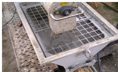
Amassadura do BETÃO-S PROJ 25