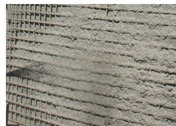
Aplicação da primeira camada