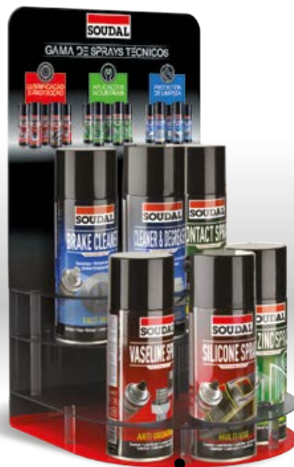
EXPOSITOR DE BALCÃO Código: 154646 Conteúdo: 6x400ml