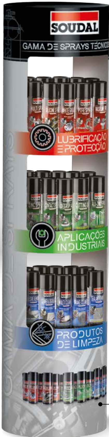
EXPOSITOR DE CHÃO Código: 154651 Dimensões. cm 38ø x157(H) Conteúdo:12 latas/prateleira